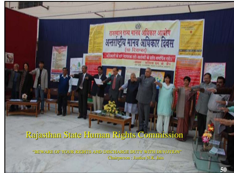
Rajasthan State Human Rights Commission

"BEWARE OF YOUR RIGHTS AND DISCHARGE DUTY WITH DEVOTION" Chairperson : Justice N.K. Jain