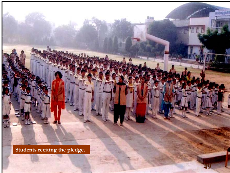
Students reciting the pledge.